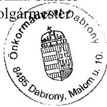
Kozma Sándor polgármester